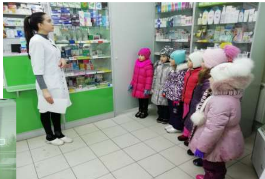
Экскурсия в аптеку