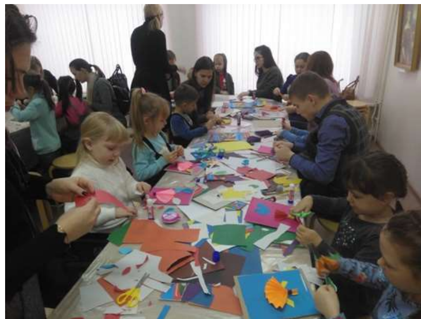
Мастер-класс в музее