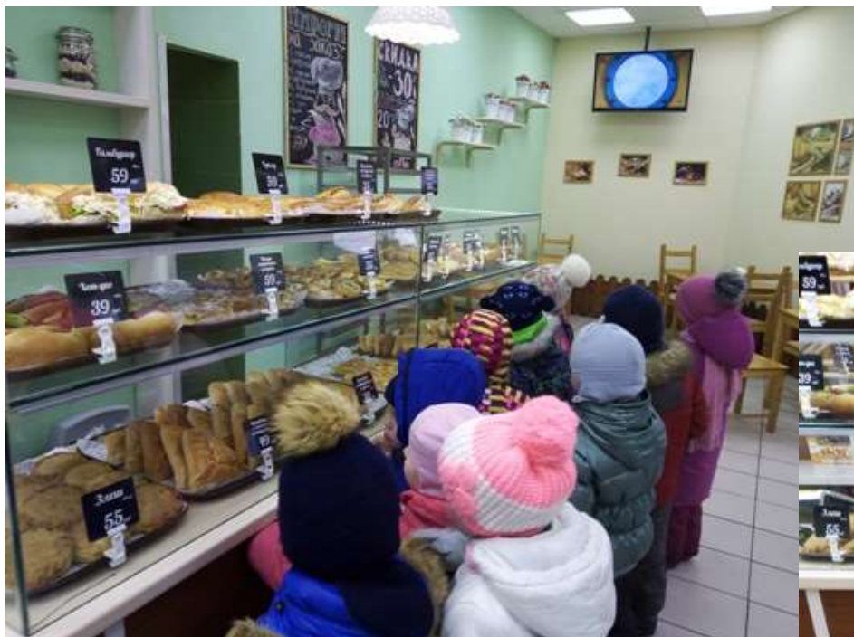
Экскурсия в пекарню